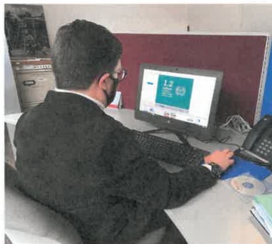
Difusión de video informativo referente al CCN.

Durante el periodo reportado en este Comunicado, se han realizado diversas actividades apegadas al Código de Conducta Nacional, dentro de las que destaca una conferencia sobre el CCN impartida por la SECTUR dirigida al personal del Fondo, la publicación de un video informativo y una infografía sobre la materia en el sitio de intranet del FONATUR, así como la actualización del Banner que dirige al micrositio donde se encuentra toda la información referente al Código de Conducta Nacional para la Protección de Niñas, Niños y Adolescentes en el Sector de los Viajes y el Turismo.