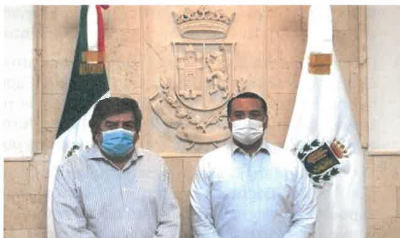
Firma de convenio entre el FONATUR y el Ayuntamiento de Mérida, Yucatán.

Del total de hectáreas que comprende la reserva, el Proyecto Regional Tren Maya contempla ocupar directamente 30, apenas el 0.28%. En contraste, esta colaboración estratégica permitirá incrementar en casi un 10% el polígono de la reserva y asegurar la conservación de los pulmones vitales para la zona metropolitana de la Ciudad de Mérida, pues se ampliará significativamente las reservas de agua de la ciudad. Eso significa que, lejos de afectar la integridad y funcionamiento de los servicios ecosistémicos y la conectividad del paisaje, se colaborará a remediar la problemática ambiental existente.