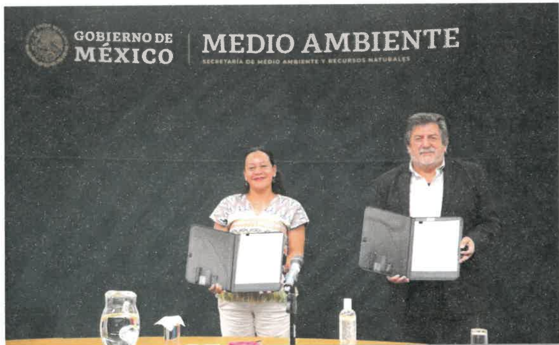
Firma de convenio entre el FONATUR y la SEMARNAT.

Dentro de las acciones para garantizar medidas de protección ambiental en el desarrollo del Proyecto Regional Tren Maya, el FONATUR y la Secretaría del Medio Ambiente y Recursos Naturales firmaron, el 27 de octubre de 2020, un convenio para dar seguimiento a los estudios de impacto ambiental, cambio de uso de suelo, riesgo ambiental, atención de pasivos ambientales y cualquier otro que, conforme a la legislación aplicable en la materia, sea necesario para el desarrollo del proyecto.