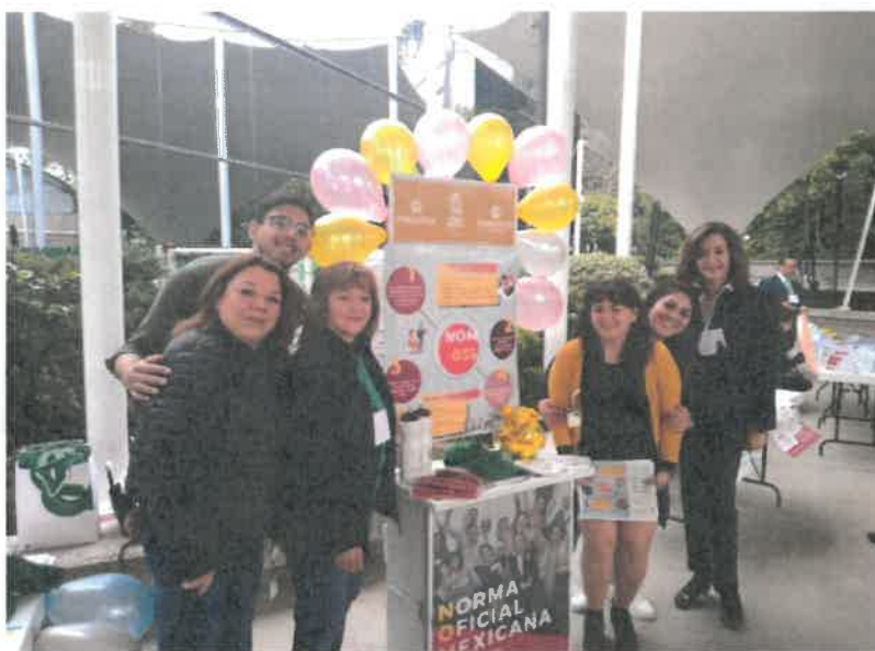
Difusión sobre la Norma Oficial Mexicana 035-STPS-2018.

Se estableció el Programa de Trabajo 2019-2021, el cual se constituye de 10 acciones generales en materia de sensibilización al personal, la implementación de metodologías para la identificación de acontecimientos traumáticos severos y de factores de riesgo psicosocial, así como la evaluación del entorno organizacional, y que al mes de octubre de 2020 tiene un avance del 57%.