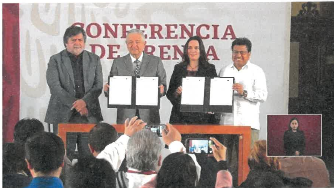
Firma de convenio con el Instituto Nacional de los Pueblos Indígenas y la Secretaría de Gobernación para realizar una Consulta Indígena

En este sentido, el FONATUR firmó el 14 de noviembre de 2019, un convenio con el Instituto Nacional de los Pueblos Indígenas y la Secretaría de Gobernación para realizar una Consulta Indígena bajo directrices establecidas por la Organización Internacional del Trabajo, la Comisión Interamericana de Derechos Humanos y la Comisión Nacional de Derechos Humanos; además de las determinaciones contenidas en las sentencias de la Corte Interamericana de Derechos Humanos y la Suprema Corte de Justicia de la Nación, a fin de garantizar el derecho a la consulta libre, previa, informada, de buena fe y culturalmente adecuada con los pueblos y comunidades indígenas relacionadas con el proyecto.