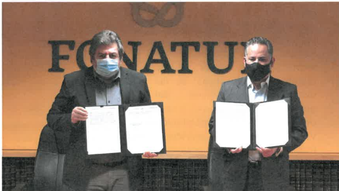
Firma de convenio entre el FONATUR y la Unidad de Inteligencia Financiera (UIF) de la Secretaría de Hacienda y Crédito Público.

medidas de prevención y combate a los delitos de operaciones con recursos de procedencia ilícita que puedan permear en las licitaciones que se llevan a cabo en el desarrollo de este proyecto.