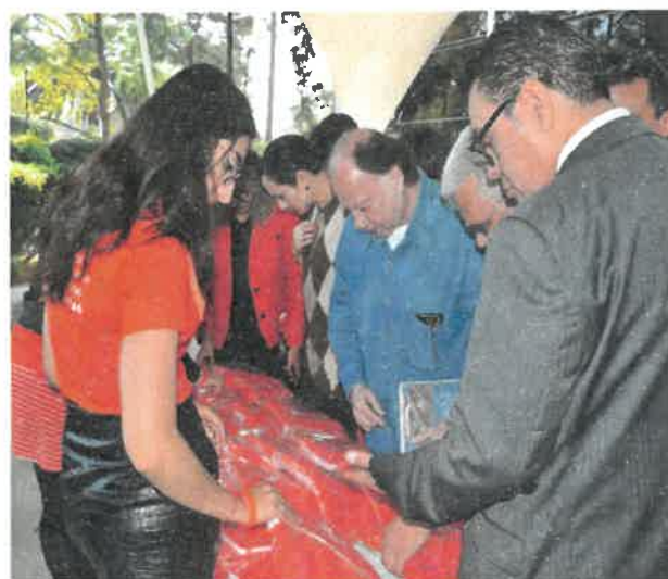
Entrega de playeras en apoyo a la iniciativa de la ONU del Día Naranja.

Durante los meses de noviembre y diciembre de 2019, se realizaron eventos para el personal sobre la concientización contra la violencia a las mujeres, mediante una obra de teatro y la entrega de playeras en apoyo a la iniciativa de la ONU del Día Naranja; asimismo, se colocó en las instalaciones un túnel informativo en coordinación con el Museo Memoria y Tolerancia, con información sobre los genocidios más conocidos en la historia de la humanidad.