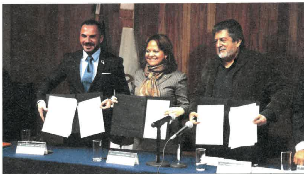
Firma de convenio entre el FONATUR y la UNESCO

En suma, para que el Proyecto Regional Tren Maya sea integral y otorgue sostenibilidad a largo plazo y un desarrollo inclusivo, el FONATUR y la oficina en México de la Organización de las Naciones Unidas para la Educación, la Ciencia y la Cultura (UNESCO), firmaron, el 18 de diciembre de 2019, un Convenio Macro de Colaboración para brindar acompañamiento al proyecto.