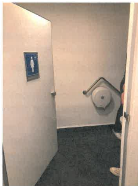
Instalaciones en oficinas centrales accesibles para personas con discapacidad.

Por lo tanto, las acciones que el FONATUR lleva a cabo en atención al Pacto Mundial son el procedimiento de reclutamiento y selección con igualdad de oportunidades; el Código de Conducta que contempla el principio de igualdad y el derecho a la no discriminación y; el mecanismo de atención a denuncias por violencia laboral y discriminación.