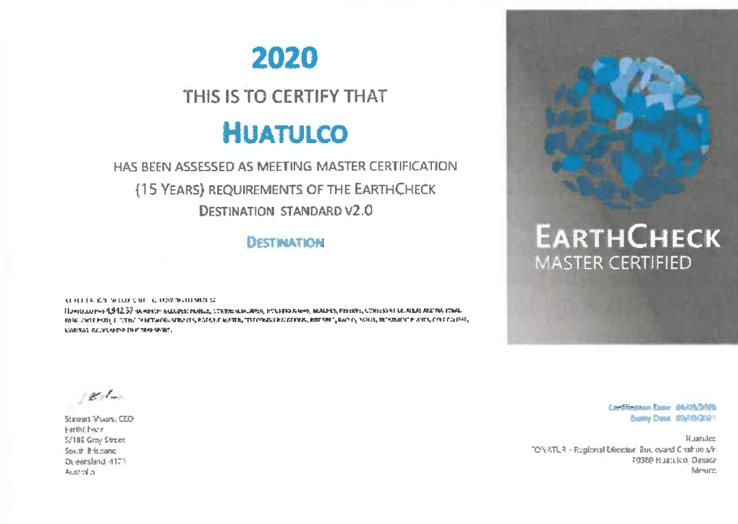
Certificación EarthCheck Master otorgado al CIP Huatulco en 2020.

En el 2020, se alcanzó el nivel MASTER de la certificadora EarthCheck , máximo nivel de certificación, con esto Huatulco se convierte en la única comunidad a nivel mundial en lograr este distintivo.