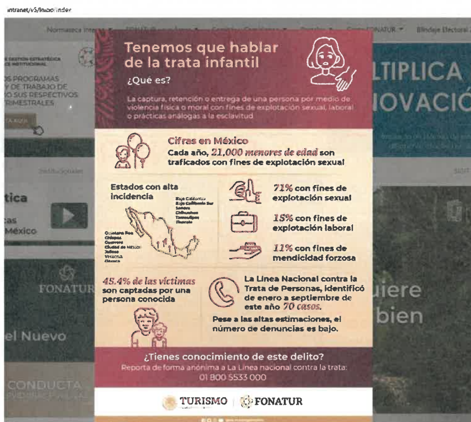
Publicación de infografía en intranet referente al CCN.