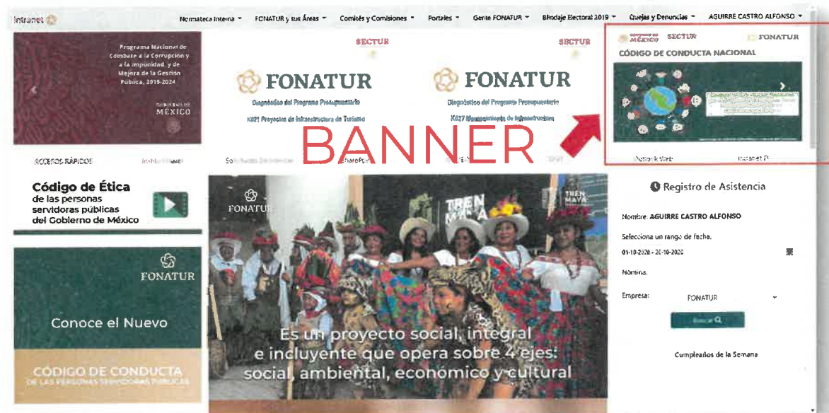
Banner en el sitio de intranet del FONATUR referente al CCN

Desde el año 2016, el Fondo Nacional de Fomento al Turismo se encuentra adherido al Código de Conducta Nacional para la Protección de Niñas, Niños y Adolescentes en el Sector de los Viajes y el Turismo (CCN), rechazando tajantemente la trata de personas en cualquiera de sus modalidades. Desde dicha adhesión, el Fondo ha implementado acciones en sus oficinas centrales y en sus desarrollos turísticos.